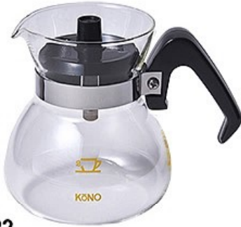
MD-22 ガラスポット2人用