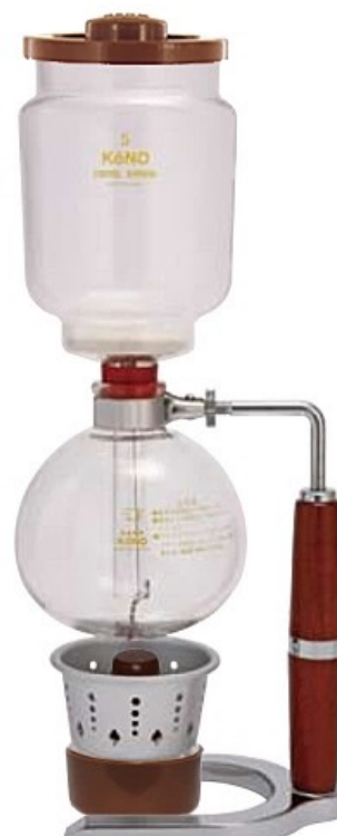
4人用 SK-4A SK-4G