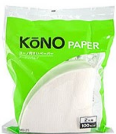
MD-25W ペーパー2人用 (100枚入) ホワイト