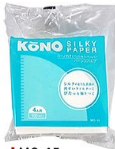
MS-45 シルキーペーパー 4人用 100枚入