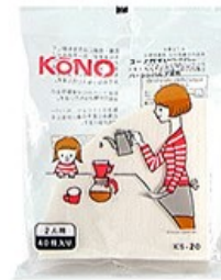
KS-20 ドリップ名人 ペーパー2人用 40枚入