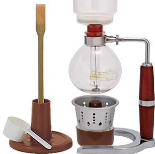
2人用 SK-2A SK-2G