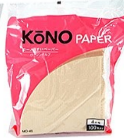
MD-45B ペーパー4人用 (100枚入) ブラウン