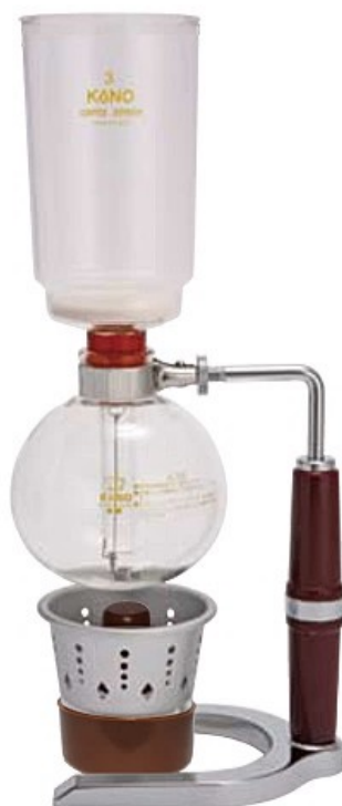
3人用 PR-3A PR-3G