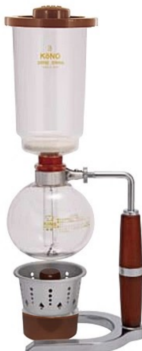
3人用 SK-3A SK-3G