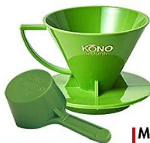
MDN-20LG 名門2人用ドリッパーセット ライトグリーン