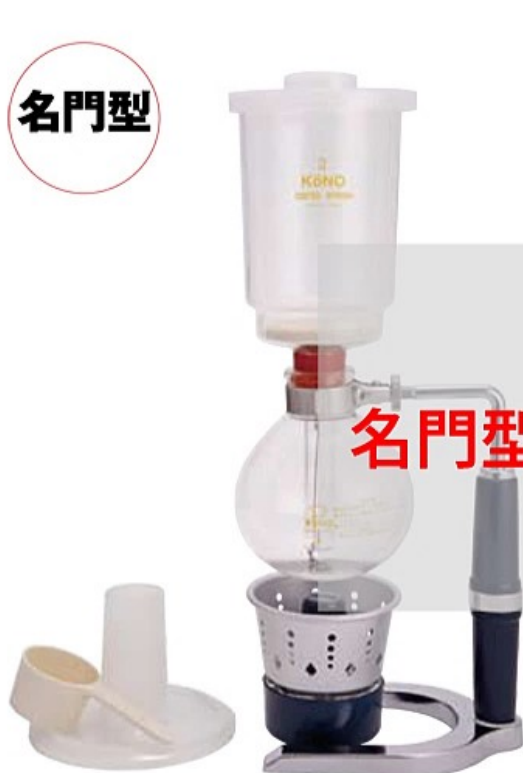
2人用 MM-2A MM-2G