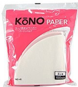
MD-45W ペーパー4人用 (100枚入) ホワイト