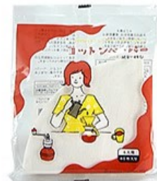
MD-46C コットンペーパー 4人用 40枚入