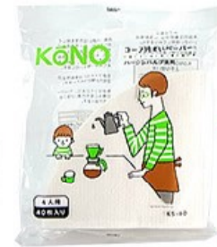
KS-40 ドリップ名人 ペーパー4人用 40枚入