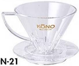
MDN-21 名門フィルター2人用