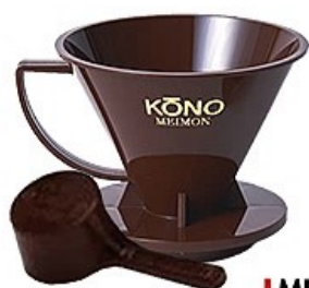
MD-40CH 名門4人用ドリッパーセット チョコレート