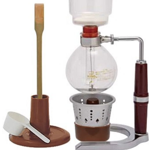
2人用 PR-2A PR-2G