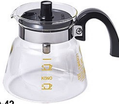
MD-42 ガラスポット4人用