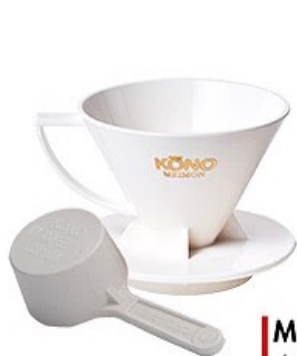
MDN-20WH 名門2人用ドリッパーセット ホワイト