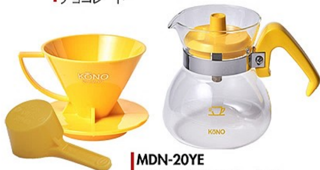
MDN-20YE 名門2人用ドリッパーセット イエロー