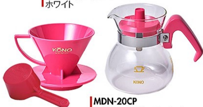
MDN-20CP 名門2人用ドリッパーセット チェリーピンク