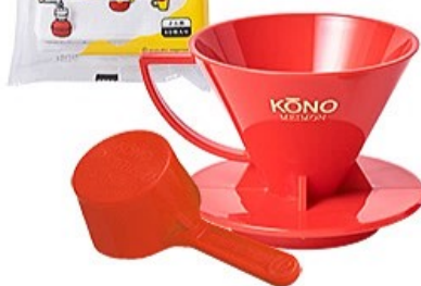
MDN-20RD 名門2人用ドリッパーセット レッド

2人用カラード リッパーセットに はコットンペー パーMD-26Cが 付きます。