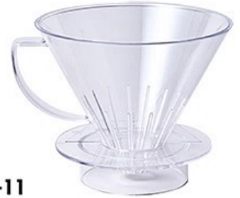
MDN-11 名門フィルター10人用