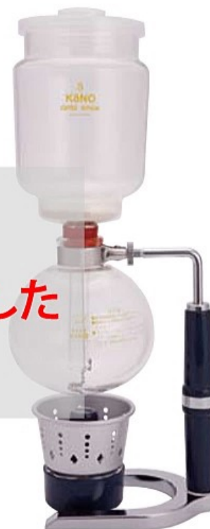
4人用 MM-4A MM-4G