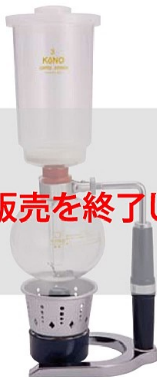
3人用 MM-3A MM-3G