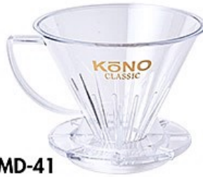
MDN-41 名門フィルター4人用