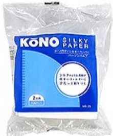
MS-25 シルキーペーパー 2人用 100枚入