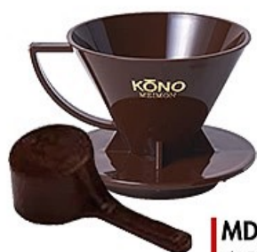
MDN-20CH 名門2人用ドリッパーセット チョコレート