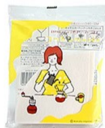
MD-26C コットンペーパー2人用 40枚入