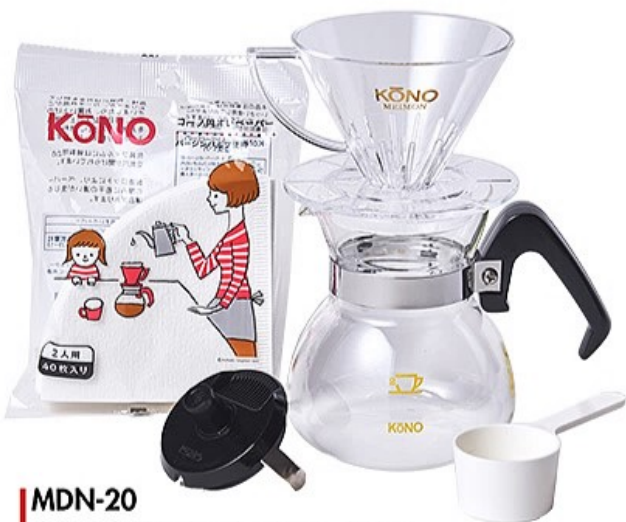
MDN-20 名門2人用ドリッパーセット クリア ※ペーパーフィルターはKS-20が付きま