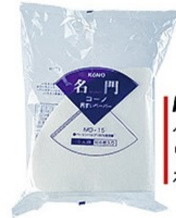
MD-15 ペーパー10人用 (100枚入) ホワイト