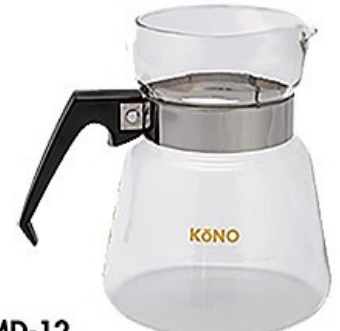
MD-12 ガラスポット10人用(フタなし)