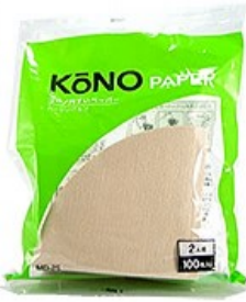
MD-25B ペーパー2人用 (100枚入) ブラウン