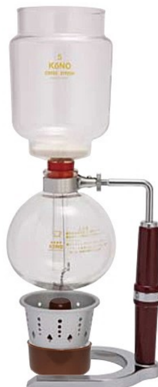
4人用 PR-4A PR-4G